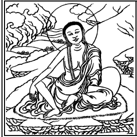
ཕ ལྷ་མིལ་བཞད་པ་དྲེང་ལ་ནམོ།