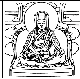
ལྷ དུགས་པོ་རྩེད་གཞོན་ལ་ནམོ།

།དབྱེར་མེད་གཉུག་མའི་རང་འགྲོས་ཉིད། །རང་དོ་སྡོད་སྤྱིར་འདིར་བཞད་བྱ། །དེ་ཡང་རྒྱུ་པ་ བའི་བཀའ་རབ་འབྱུངས་མཐའ་ཡས་པ་ཀུན་གྱི་དགོངས་པའི་སྡིང་པོ་ནི་འགྲོ་བའི་ཁམས་ལ་དེ་བཞིན་གཤེགས་པའི་ཡོ་ ཤེས་གྱི་སྡིང་པོ་གནས་པ་དེ་ཉིད་མངོན་གྱུར་དུ་བྱ་བའི་སྲོད་དུ་ཚོས་གྱི་རྣམ་གྲངས་སམ་ཐེག་པའི་བྱེ་བྲག་མཐའ་ཡས་